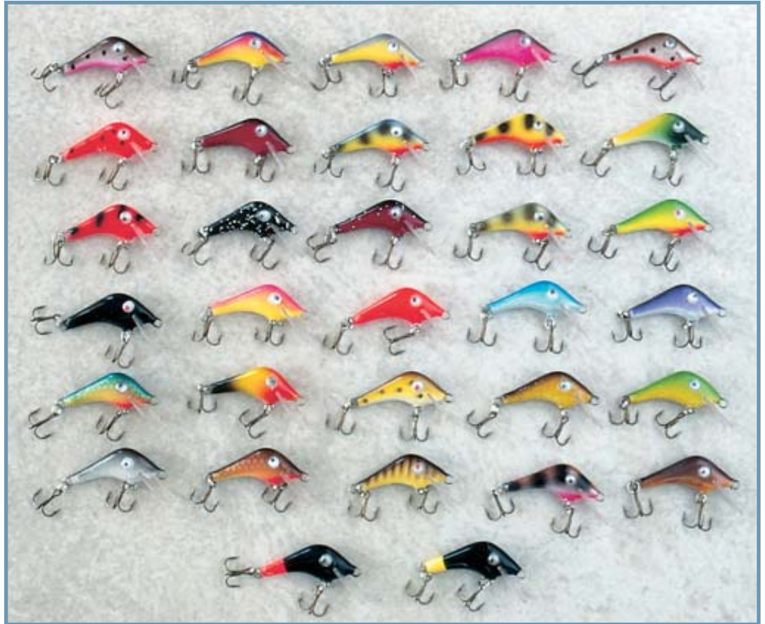
Tunnetuimman siikavaapun Seniorin laajaa värivalikoimaa.

Seniori on vaivaisen gramman painoinen, siro mikrovaappu. Perä on ohut ja kapea, uintilevy pitkä ja syvälle vetävä. Se-