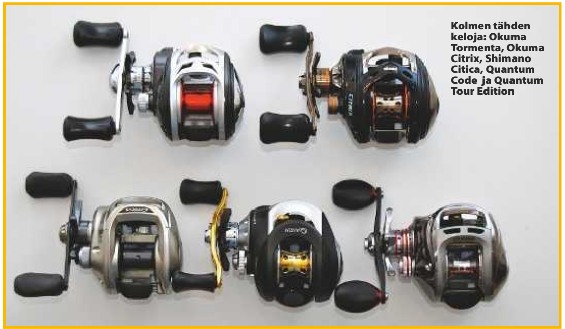
Kolmen tähden keloja: Okuma Tormenta, Okuma Citrix, Shimano Citica, Quantum Code ja Quantum Tour Edition

Arvio: Okuman halvempi malli, jossa on paljon samaa kuin Citrixissäkin, mutta pienemmän välityksen ansiosta kelausvoimaa on enemmän. Sopii hyvin käteen, toimii luontevasti ja heittää kauas, mutta rohi rumasti jo parin käyttökerran jälkeen. Kammen nupit ovat isot ja liukkaat.