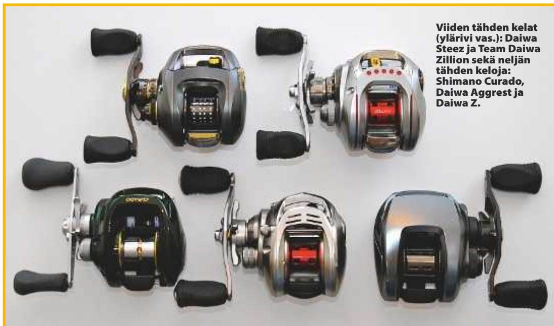
Viiden tähden kelat (ylärivi vas.): Daiwa Steez ja Team Daiwa Zillion sekä neljän tähden keloja: Shimano Curado, Daiwa Aggrest ja Daiwa Z.

Arvio: Halvin ja jouhevin Revo, mutta muiden tavoin tätäkin vaivaa jäykkä liipaisin. Kampi on parempi kuin kalliimmissa mallissa, sillä suora varsi ei hinkkaa sormille. S-mallista puuttuu