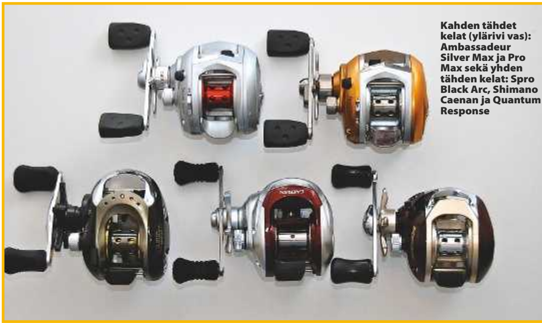
Kahden tähden kelat (ylärivi vas): Ambassadeur Silver Max ja Pro Max sekä yhden tähden kelat: Spro Black Arc, Shimano Caenan ja Quantum Response

Kuulalaakerien määrä: 5+1 / 7+1 Välitys: 6,2:1