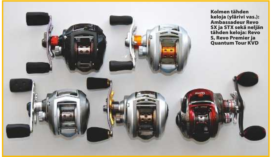
Kolmen tähden keloja (ylärivi vas.): Ambassador Revo SX ja STX sekä neljän tähden keloja: Revo S, Revo Premier ja Quantum Tour KVD