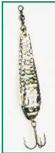
▲ Tämä 18 g Inkoo on pelastanut monet kalapäivät.