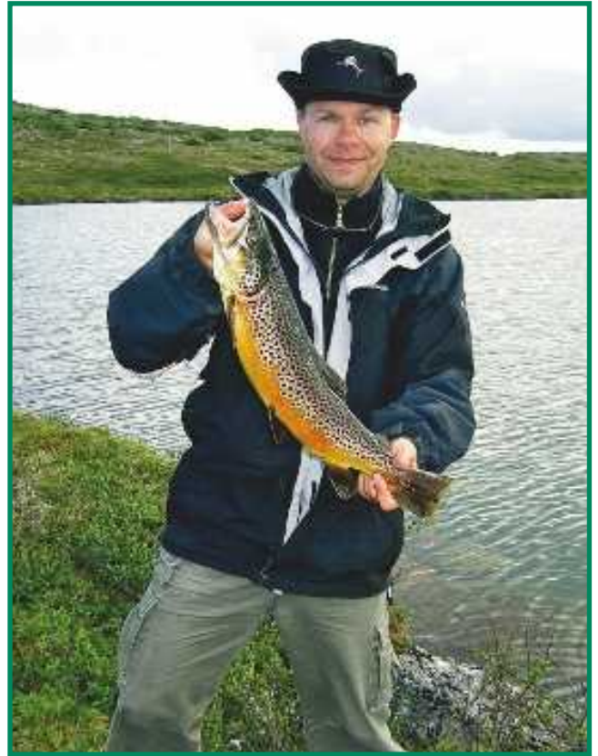
▲ Tämän kaliiperin taimen vetää jo suuta hymyyn.