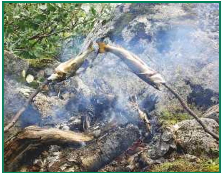
▼ Tunturikalastajan lounas maistuisi varmaan sinullekin.

suvannosta valtavia ahvenia. Ne maistuivat voissa paistettuina mainioilta, mutta vielä enemmän halusin maistaa Lapin taimenia.