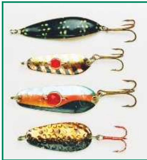
▲ Elokuun lusikoissa saa olla lämpimiä sävyjä. Ylinnä EV Trutta yökalastukseen, sitten 4- ja 5-senttiset Räsäset ja Blue Fox Möre Ungen.