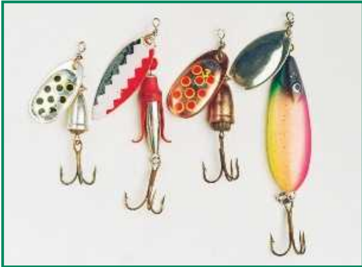
Elokuun lippoja. Oikealla isokokoinen Lotto, sitten Blue Foxin lippa ja seuraavana Kuusamon Uistimen Finlandia-lippa ja Blue Foxin hopeamusta lippa (vas.). Elokuussa lämpimät sävyt toimivat auringonlaskun aikaan.