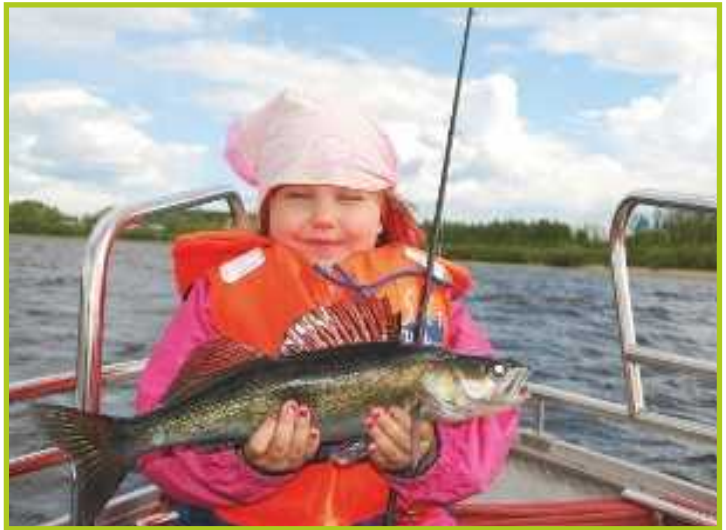
Alkukesästä saaliin saaminen Kyrösjärvellä on joskus helppoa lapsillekin.

ta. Erittäin kevyt jigipää on hämärissä luonnollinen silinto, koska kuhia tavoitellaan silloin alle metrimestä vedestä. Varsinkin fosforinvärisiksi värjätty on ollut omiaan niin Kyrösjärvellä kuin merialueillakin.