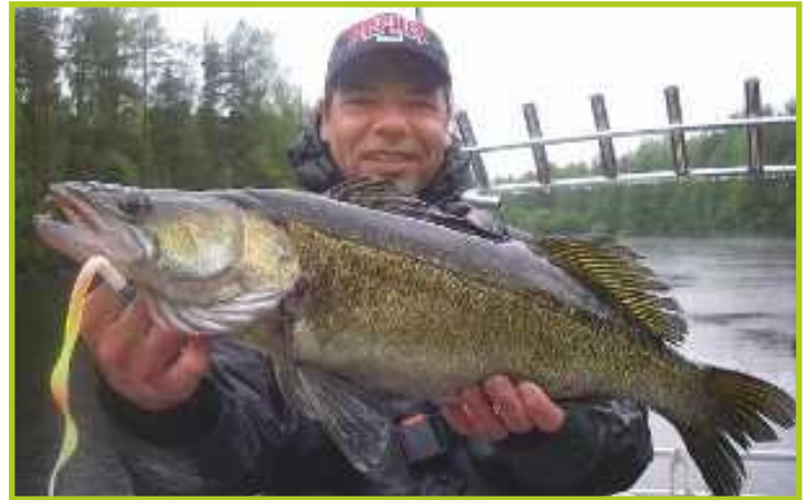
Jari Kokkosen virtavedestä saama kuhaköriläs.

Lisätietoja klo 9-16 Via Naturale Oy puh (09) 8709 857