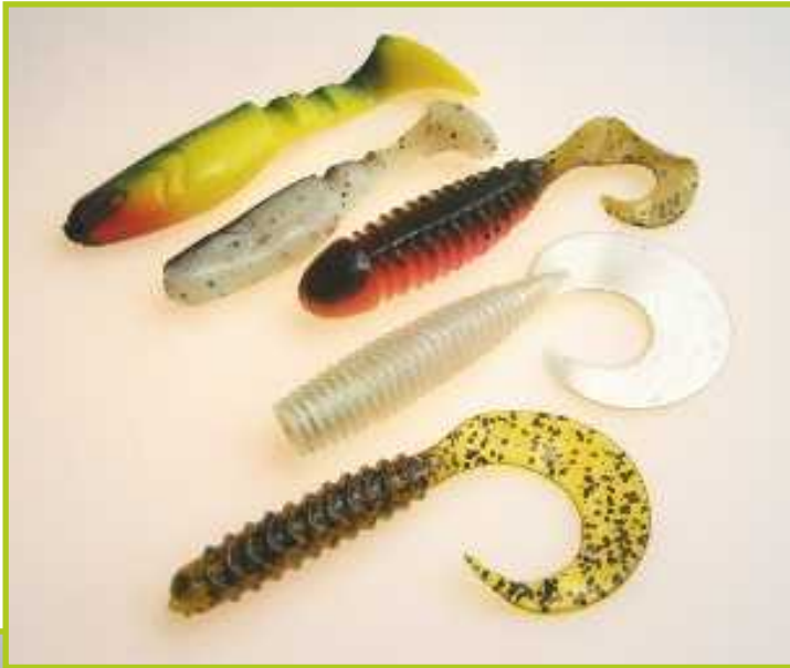
Seisovan veden jigejä ylhäältä alaspäin: Ripper Kopyto Relax 3", Mann's Predator 2,5", Yum Curltail 4", Storm Pro Grub 5" ja Fepp-toukkajigi 4".