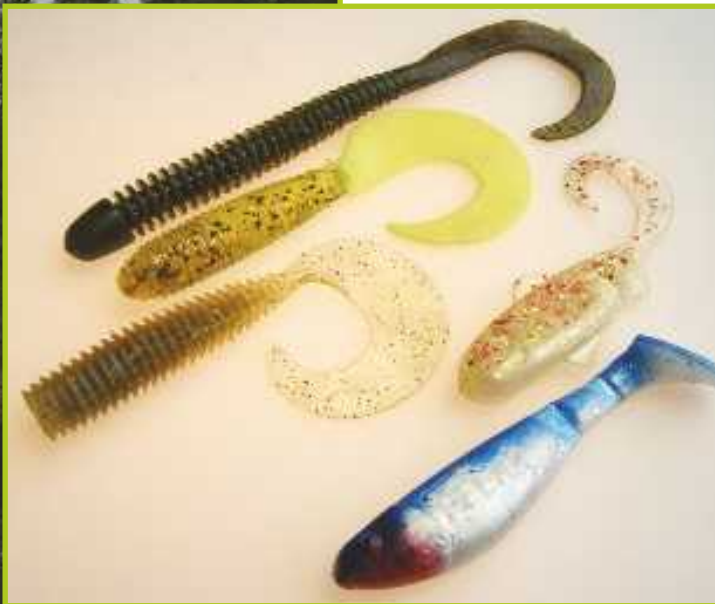
Virtavesijigejä ylhäältä alaspäin: Yum Rib Worm 6", Kopyto Twister 4", Storm Pro Grub 4", Banjo Kopyto 3" ja Ripper Kopyto Relax 2,5".

Ja oikeassa oli. Rantapunnitus antoi kōriläälle painoksi 6 250 g ja pituudeksi 87 cm. Kyllä sokea kanakin jyvän löytää, kun oikein ahkerasti nokkii. Ja kun mukana on kotivetensä tunteva opastaja.