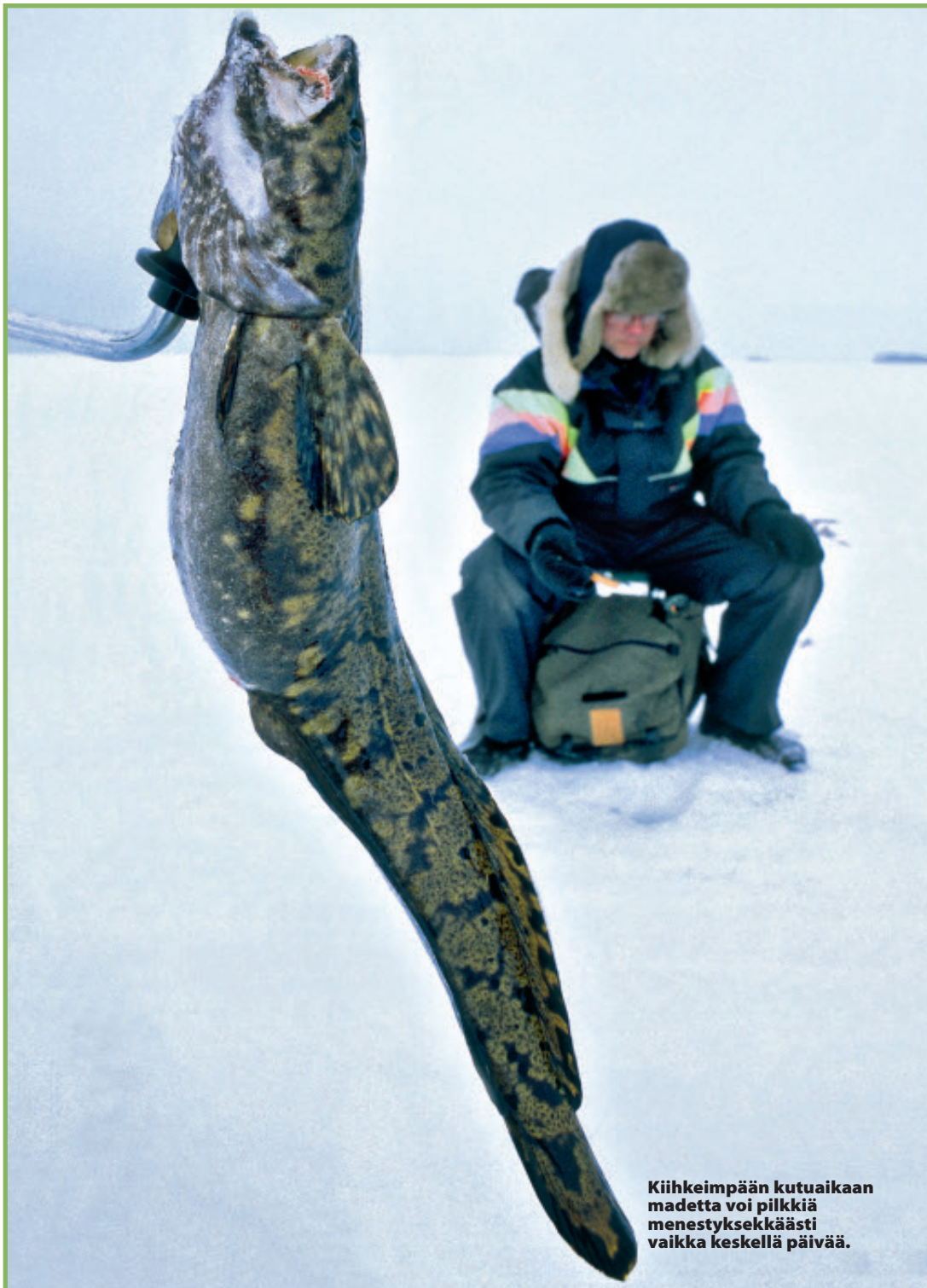
Kiihkeimpään kutuaikaan madetta voi pilkkiä menestyksekkäästi vaikka keskellä päivää.