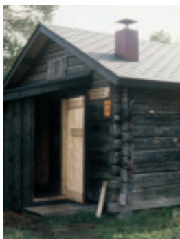
Kärppätupa – yksi järven autiotuvista.

Järvelle on syytä ottaa mukaan kastumisen, katoamisen tai palamisen varalta myös varakartta, joksi käy vaikkapa järven ulkoilukartta mitakaavaltaan