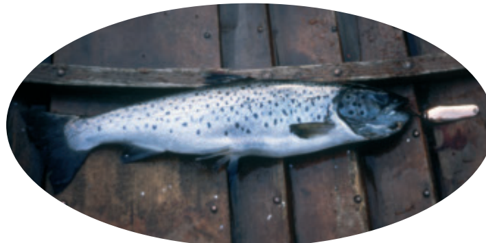
Taimen on Inarilla uistelijan mieleen.

sa. Jäät lähtevät yleensä viimeistään juhannuksen tienoilla, jolloin myös retkeilijän kannattaa välittömästi suunnata veneen