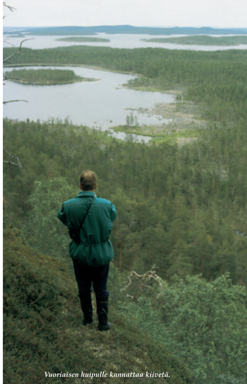
Vuoriaisen huipulle kannattaa kiivetä.

kannattaa menomatalla ehdottomasti pistäytyä autolla Tuulispään huipulla. Tunturi sijaitsee muutama kilometri etelään kirkonkylästä ja sinne johtaa jyrkkä tie. Tuulispäältä avautuu maisema yli koko järvielangan selkineen, saarineen ja pitkin kapeine salmineen.